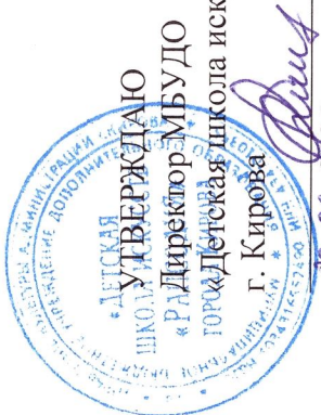
График образовательного процесса